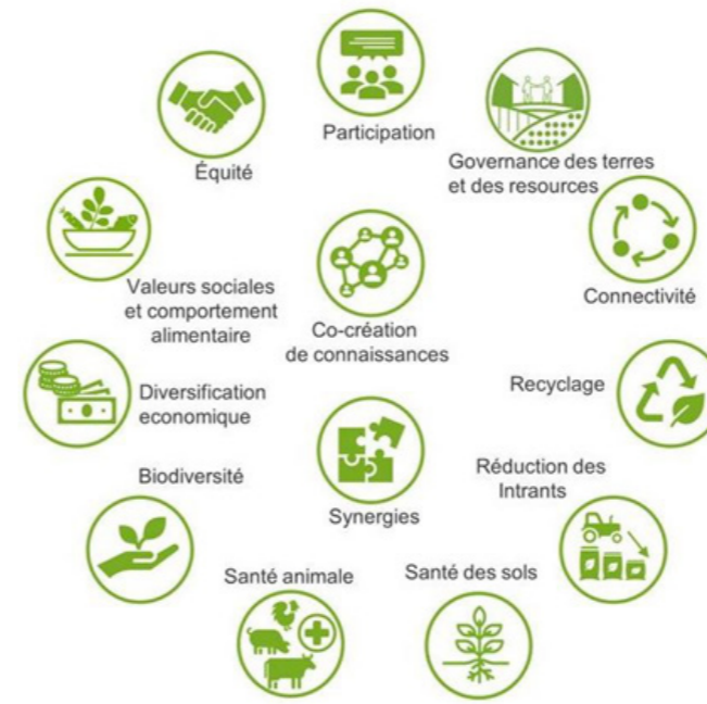
FIGURE 3 : les treize principes fondateurs de l'agroécologie (HLPE 2019)

Les résultats des financements de la PAC, qui représentent 79,8% des financements analysés, méritent également quelques explications. Pour la PAC 2014-2022, seuls 2% du premier pilier et 15% 6 du deuxième pilier sont identifiés comme contribuant effectivement à l'agroécologie. La contribution est donc faible, surtout que les montants du premier pilier dépassent largement ceux du deuxième. Ces résultats sont en phase avec les conclusions de la Cour des Comptes européenne selon laquelle la contribution de la PAC aux objectifs de préservation de la biodiversité et de lutte contre le changement climatique est nulle ou limitée 7 . Il y a une légère amélioration avec la nouvelle PAC 2023-2027 mais sans augmentation drastique : 5% pour le premier pilier malgré l'inclusion des éco-régimes et 27% pour les éléments du deuxième pilier qui ont pu être analysés. Cette étude, malgré ses limites, renforce le sentiment déjà largement partagé au sein de la société civile et du monde académique 8 : la PAC a des ambitions de transformation de l'agriculture et de l'alimentation beaucoup trop faibles par rapport aux enjeux sociaux et environnementaux du secteur.